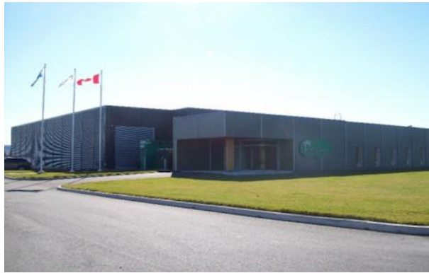
魁北克省租赁的植物药物工厂